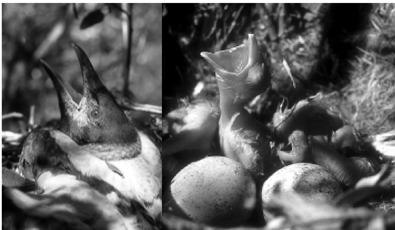
FOTO DO ARTYKUŁU: WRONA W PARKU NARODOWYM "UJŚCIE WARTY" – DRAPIEŻNIK W PTASIM RAJU